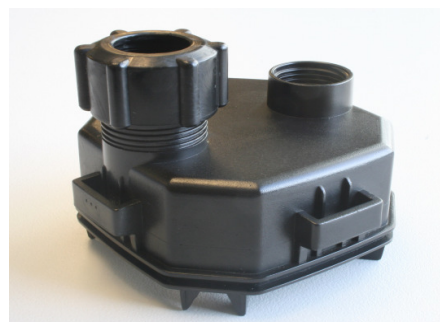
PH-sensor connector unit