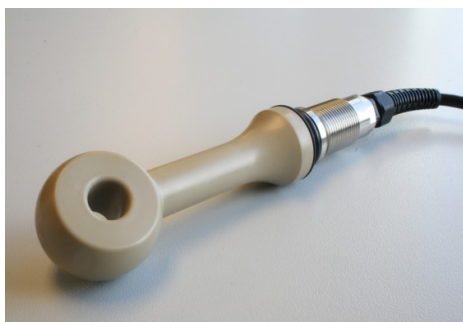
PEEK sensor voor PH-metingen