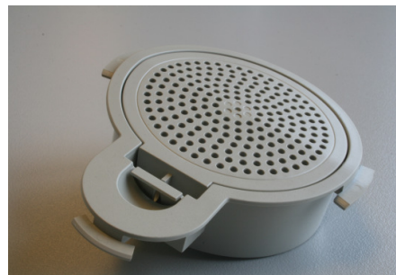
Luchtfiltratie unit voor mobiel zuurstof aggregaat